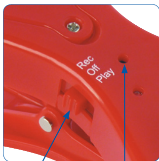
Tlačítko zapínání REC/OFF/PLAY