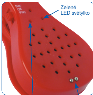
Zelené LED světýlko